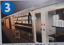
ディスカバーームナード

アラムライブラリーの中央フロアから三方に階段があり、3.5階へと通じています。3.5階は私語読書や勉強や読書に集中できる空間になっていてとても静かです。本当に物音が全くないので何かに集中したいときはここで作業するのがおすすめです！