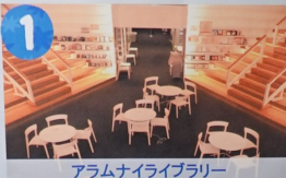
アラムライブラリー