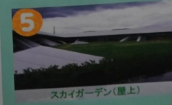
スカイガーデン(屋上)

タイトルにあるACADEMIC-ARK CAFETERIAのCAFETERIAはこの事です。 タイトルにあるACADEMIC-ARK CAFETERIAのCAFETERIAはこの事です。 メインとしてハンバーグ、チキン南蛮、生麦焼きのどれかが選べて、さらに小鉢が2つ選べる450円の定食が人気です！唐揚げ定食の唐揚げがおすすです。総持寺のキャンパスでは一般開放もしているのでぜひお越しください！地域情報も発信し交流できる「まちライブラリー」もあります！