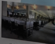
150th MARUZEN ・京都精華大学図書館 （図書館業務委託：丸善雄松堂株式会社）