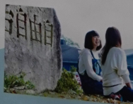
・京都精華大学（司書課程）