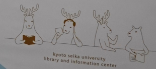
kyoto seika university library and information center